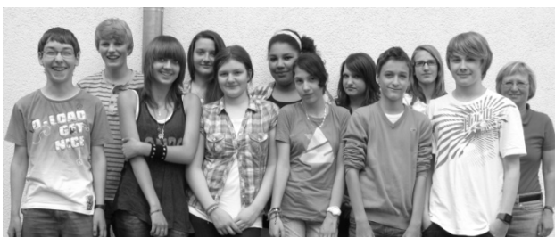
Konfirmandengruppe Ost, 22. Mai 2011