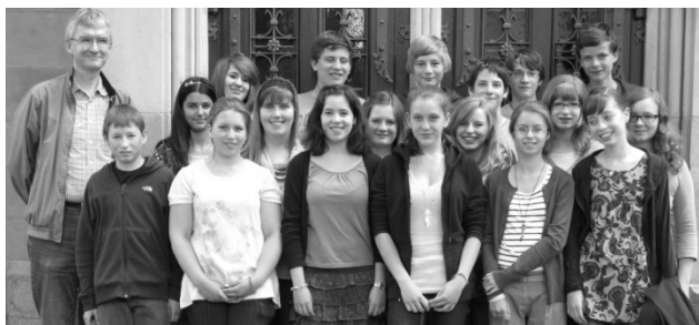
Konfirmandengruppe West, 15. Mai 2011